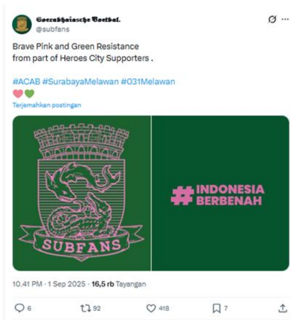
Gambar 3. Postingan twitter @subfans

Tautan: https://x.com/subfans/status/1962541316442841498?s=20