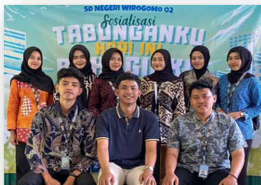
Gambar 3. Foto Bersama