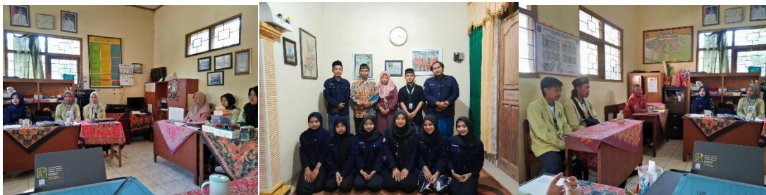
Gambar 1. Dokumentasi Sowan SD dan Kepala Dusun Segiri

Pada pelaksanaannya, mekanisme aksi di lapangan dimulai pada pekan pertama yakni diawali dengan sowan rumah ke rumah pemerintah desa, tokoh masyarakat, seperti kepala dusun, Ketua RT, Kyai Dusun, Takmir Masjid, Ketua Karang Taruna, dan Ketua TPA. Hal ini dilakukan untuk menyambung silaturahmi serta mengumpulkan informasi terkait dengan kegiatan yang telah terlaksanakan maupun yang akan terlaksana guna sinkronisasi dan kolaborasi program tim KKN.