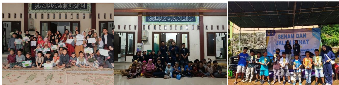
Gambar 7. Dokumentasi Kegiatan Perlombaan Festival Anak Sholeh dan Pembagian Trophy kepada Pemenang

Sebagai tindak lanjut atau follow up dari pembelajaran yang diberikan kelompok KKN 92 akan diadakan perlombaan yang mengusung konsep religi dengan nama kegiatan “Festival Anak Sholeh”. Kegiatan lomba diikuti oleh anak-anak dari tingkatan PAUD sampai SD kelas 6. Perlombaan tersebut meliputi lomba adzan, lomba sholawat, lomba hafalan surat pendek, dan lomba mewarnai kaligrafi. Adanya perlombaan tersebut sebagai indikator keberhasilan melalui partisipasi anak-anak dan untuk meningkatkan semangat belajar agama.