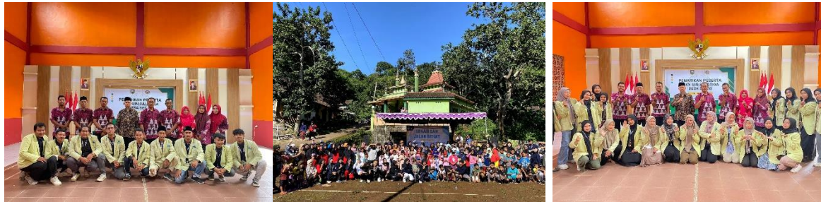
Gambar 8. Dokumentasi Kegiatan Perpisahan dan Jalan Sehat Se-Desa Segiri

Sasaran kegiatan tersebut meliputi anak-anak, remaja, ibu-ibu dan bapak-bapak, serta dihadiri segenap perangkat Desa Segiri. Guna memeriahkan kegiatan senam dan jalan sehat kelompok KKN Moderasi Beragama UIN Salatiga menyediakan doorprize dan quiz bagi yang beruntung. Sebagai bahan masukan dari pengabdian sebelumnya, dengan partisipasi seluruh lapisan masyarakat dirasa mampu tercapai unsur yang lebih baik dan mampu menjalin interaksi sosial positif yang berkelanjutan.